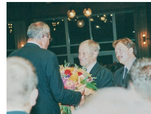
2000 Ruhesetzung von Hl. Neumaier, Ev. Körner wird Vorsteher

Gäste sind uns jederzeit herzlich willkommen!