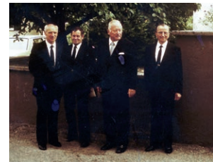
1984 Bezirksapostel Startz in Lindau