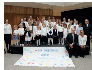
2019 Stammapostel in der Inselhalle