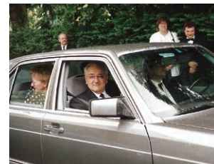
1990 Überraschungsbesuch Stammapostel Fehr