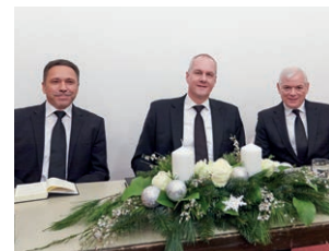
2013 Bezirksapostel in Lindau